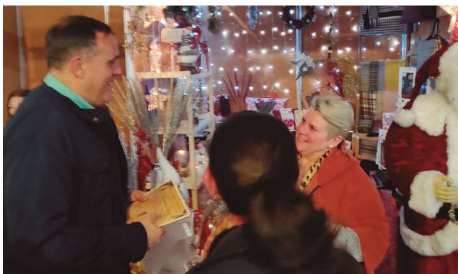
Concierto Especial de Villancicos y entrega de diplomas para clausurar el Mercado Navideño.