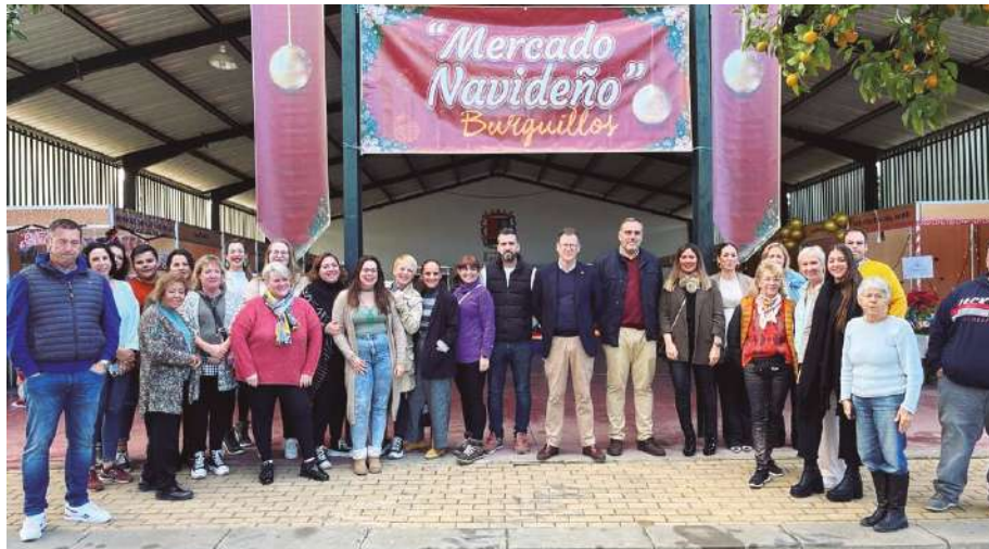
Acto de inauguración del IV Mercado Navideño.

La inauguración oficial y la apertura de la cuarta edición del Mercado Navideño, tuvieron lugar el pasado 17 de diciembre, un acto que presidió el alcalde Domingo Delgado Pino. Durante la jornada, el edil hizo también entrega de las llaves del municipio al Cartero Real para recibir a todos los niños burguillosos.