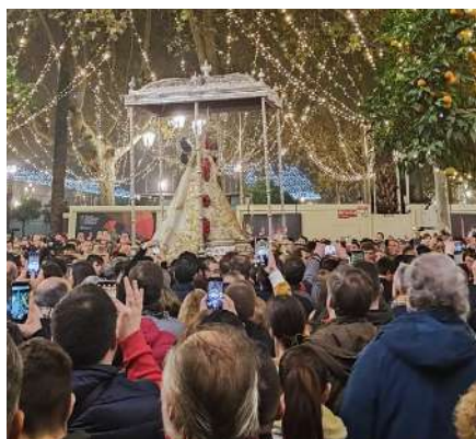
Visita a los Belenes de Sevilla.