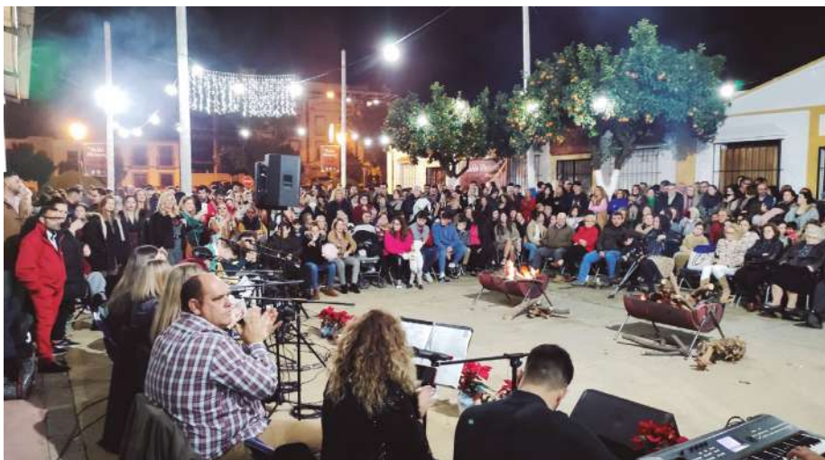
Zambomba "Burguillos canta a la Navidad".

Un día más tarde, llegaba el Concierto Especial de Villancicos, a cargo de la Banda de Música Nuestra Señora del Valle, así como la clausura del Mercado Navideño, en la que se entregaron diplomas a los participantes.