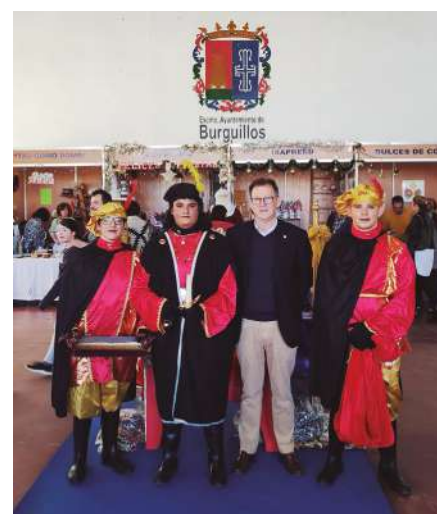
Tradicional corte de cinta en el acto inaugural y entrega de las llaves de nuestro pueblo al Cartero Real.