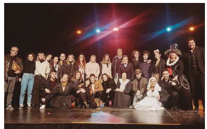
Representación de la obra "Reiniciando" y Gala de entrega de premios a cargo de la asociación de teatro Mairami.